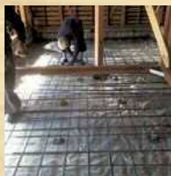
2_ [耐震point] 転圧して固めた砂利の 上に防湿シートを敷いて 鉄筋を施工した基礎補強。