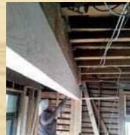
4_ [仕上げpoint] 既存の梁の下に 美しい木目の見せ梁を。

今回お披露目をする築43年のお住まいは、インスペクション(建物診断)により、耐震性に問題があることがわかりました。そこで、この機会にこれから長い時間を過ごす1Fを中心にリノベーション。耐震・断熱性能を上げ、快適で安心な空間へと生まれ変わらせることができました。☆掲載の写真(A)は、弊社施工例です。見学会の物件とは異なりますが、近いイメージのものをご覧ください。☆掲載の解体前と施行中の写真(1・2・3・4)は、見学会の物件です。見事に生まれ変わった空間を実際にご覧ください。