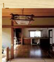
1_ [解体前] 工事前はこんなお部屋 でした。