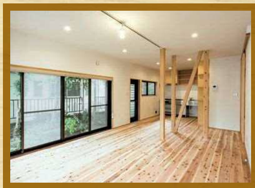
A_お庭へ続く大きな窓によりのびやかな開放感が生まれました