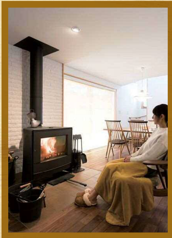
薪ペレットストーブが設置された大空間リビングで過ごす贅沢な時間。