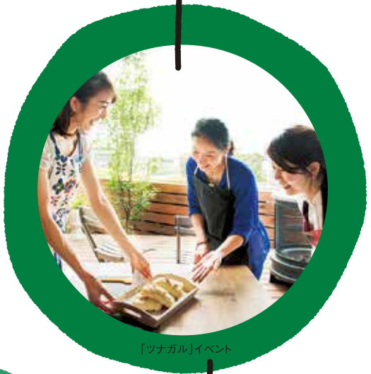
「ツナガル」イベント

近所に住まう皆さまとのご縁を大切に、心地よい距離感で、つなげていきたい。 そんな想いで「ツナガルりんご」をデザインしたフライヤーで 「ツナガル」は3年目を駆けぬけて行きます。 ごいっしょに学びを通じて「ツナガリ」を見つけてみませんか? 私たちの暮らすこの街が、 もっと安心で豊かな街になりますように。