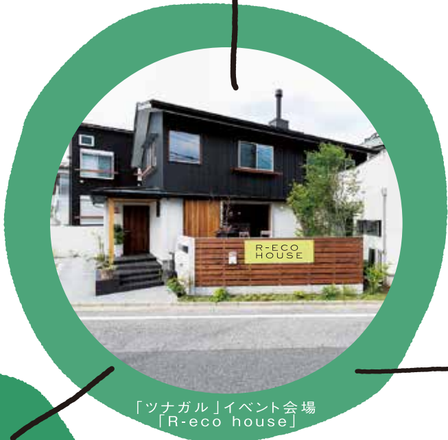
「ツナガル」イベント会場 「R-eco house」